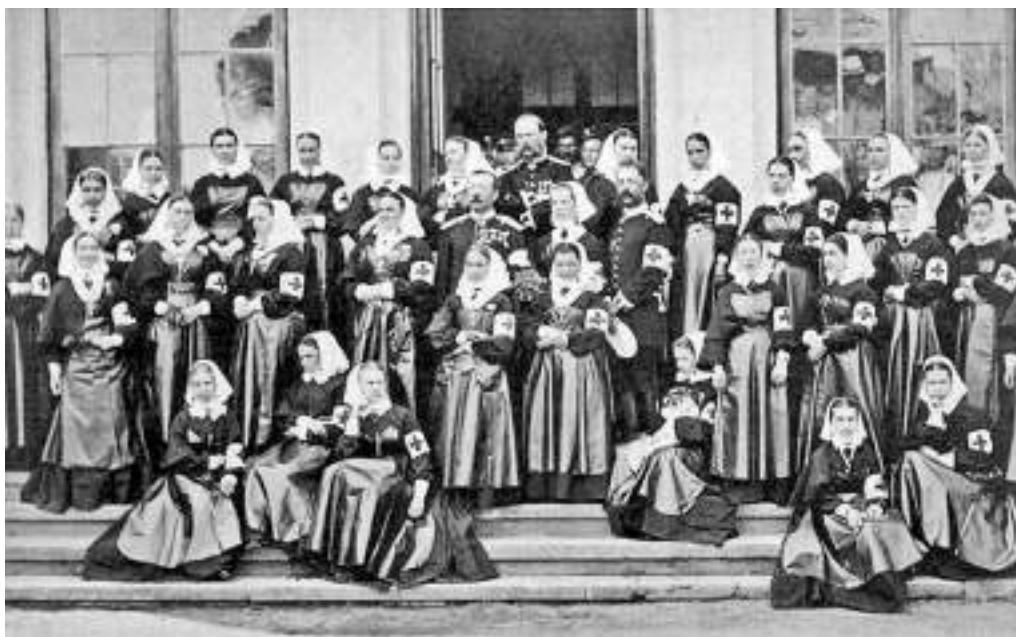
Рис. 1. Врачи и медсестры полевого лазарета русского Красного креста, ноябрь 1877

Столкновения с противником присовокупили к переменным лихорадкам, дизентерии, брюшному, сыпному и возвратному тифу раны и ушибы, нанесённые вражеским огнестрельным и холодным оружием [4, с. 274]. Искреннее сочувствие лишениям, претерпеваемых воинами, силой отстаивавших благополучие южнославянских народов, вызвало милосердный отклик соотечественников, воплощённый пожертвованиями в пользу пострадавших, несших службу. Образуемые во исполнение указа от 3(15) мая 1867 г. [3] местные Комитеты Общества попечения о раненых и больных воинах явились структурами, упорядоченно принимавшими оказанную